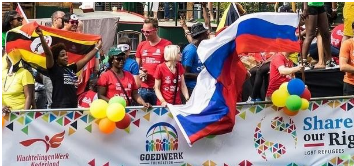
LHBTI-asielzoekers namen deel aan de botenparade tijdens Pride Amsterdam 2015