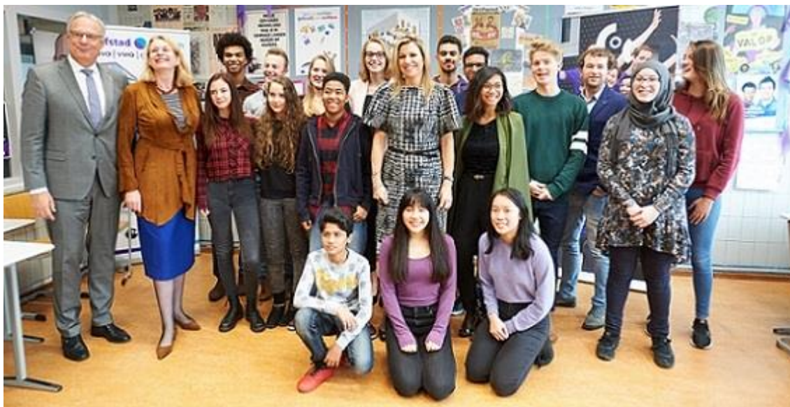
Koningin Máxima op bezoek bij het Gender & Sexuality Alliance op Hofstad Lyceum in november 2017

COC stimuleert leerlingen en docenten in het voortgezet onderwijs om zelf actief bij te dragen aan een school die veilig is voor iedereen. Gender & Sexuality Alliances (GSA's) zijn groepen leerlingen en docenten die samen een steungroep voor LHBTI-jongeren vormen en actie voeren om hun school een veilige plek te maken voor iedereen (G2). In 2016 bereikt COC hiermee meer dan 80% van de middelbare scholen en is de aanpak ook uitgebreid naar het mbo. Aan de belangrijkste landelijke actie van het GSA netwerk namen in 2015 zo'n 280.000 jongeren actief deel, zij droegen op Paarse Vrijdag paars om te laten zien dat zij vinden dat hun school een veilige school moet zijn voor iedereen (G2).