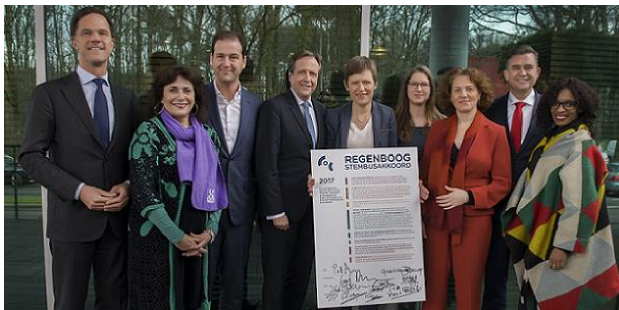
Op 6 maart 2017 tekenden partijleider COC's Regenboog Stembusakkoord

In 2018 zetten we in op het opbouwen van relaties met de in 2017 aangetreden Tweede Kamerleden en nieuwe bewindspersonen. We zullen hen voorzien van relevante beleidsinformatie over LHBTI-emancipatie. De focus ligt daarbij op het realiseren van de afspraken uit het Regenboog Stembusakkoord dat het COC in 2017 sloot met acht politieke partijen en op het uitvoeren van de politieke agenda zoals die de afgelopen jaren is opgebouwd.